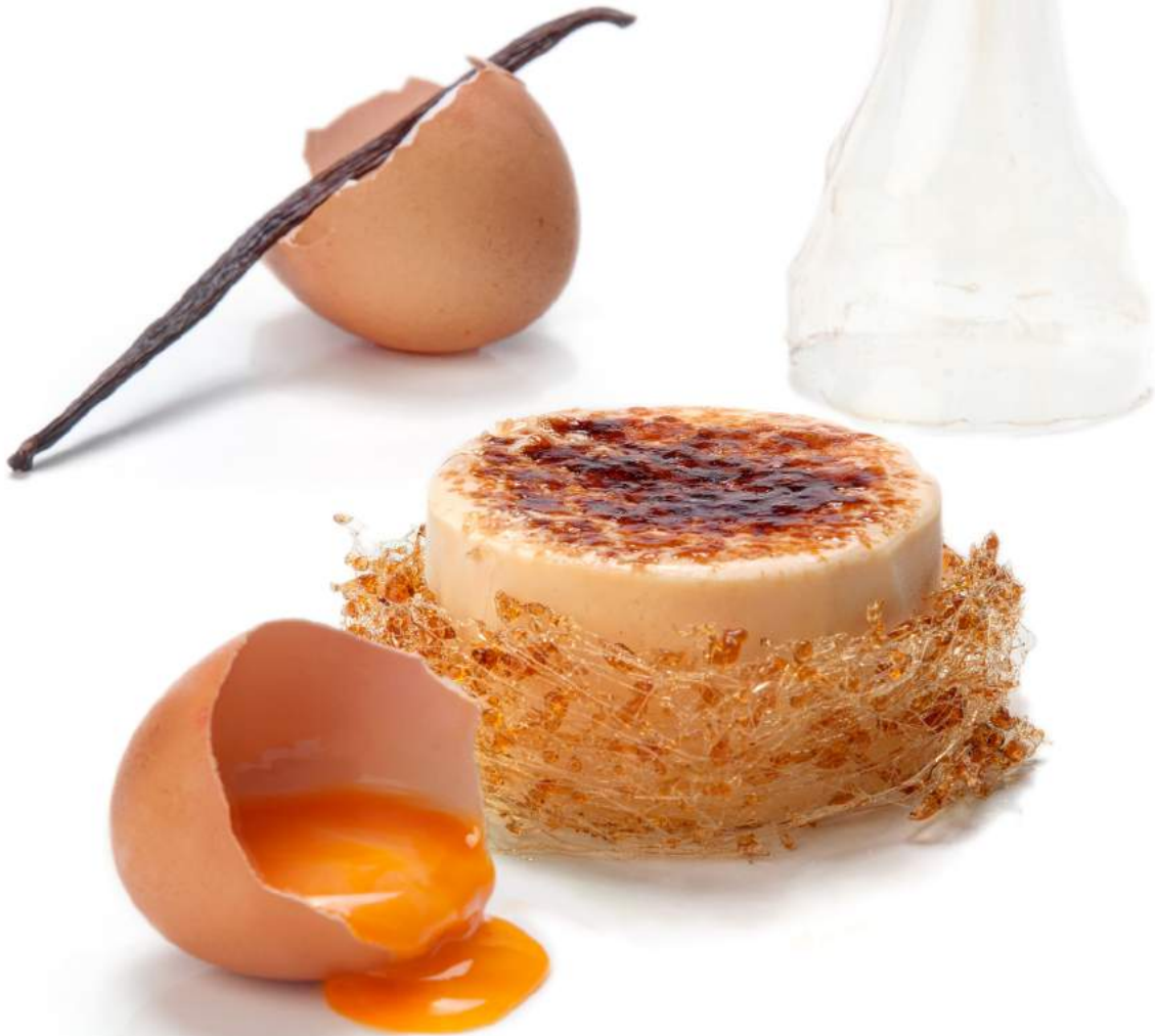
DIVO Crema Catalana