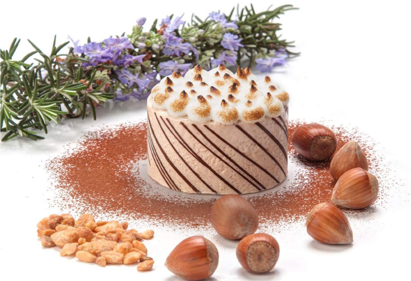
DIVO Avellana con Merengue