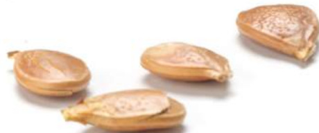
COULANT de Calabaza con Chocolate