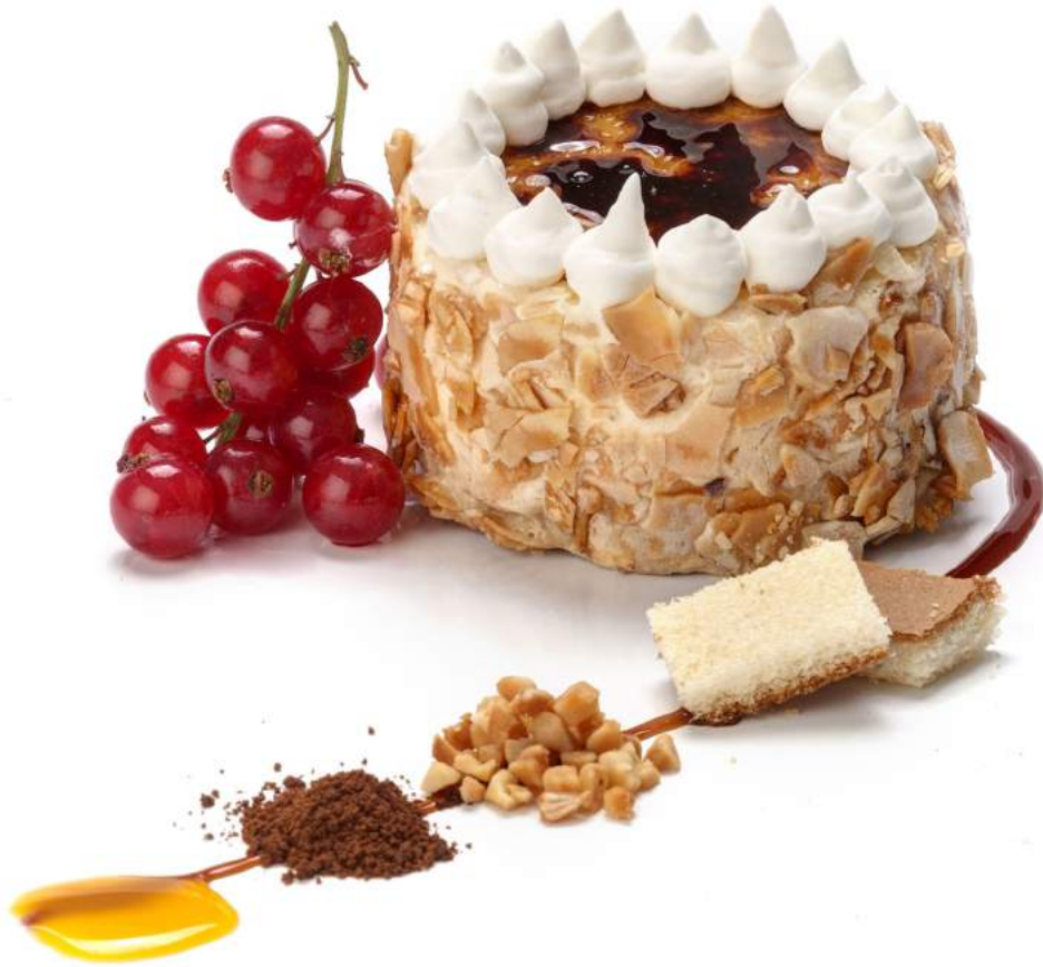
DIVO Tarta de Whisky