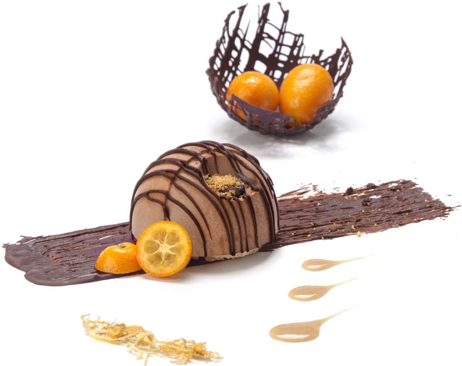
MOON Chocolate y Baileys