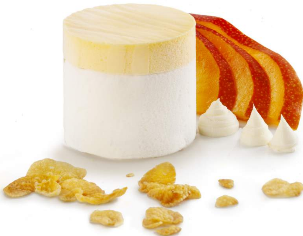
CAPRICCIO de Yogur y Mango