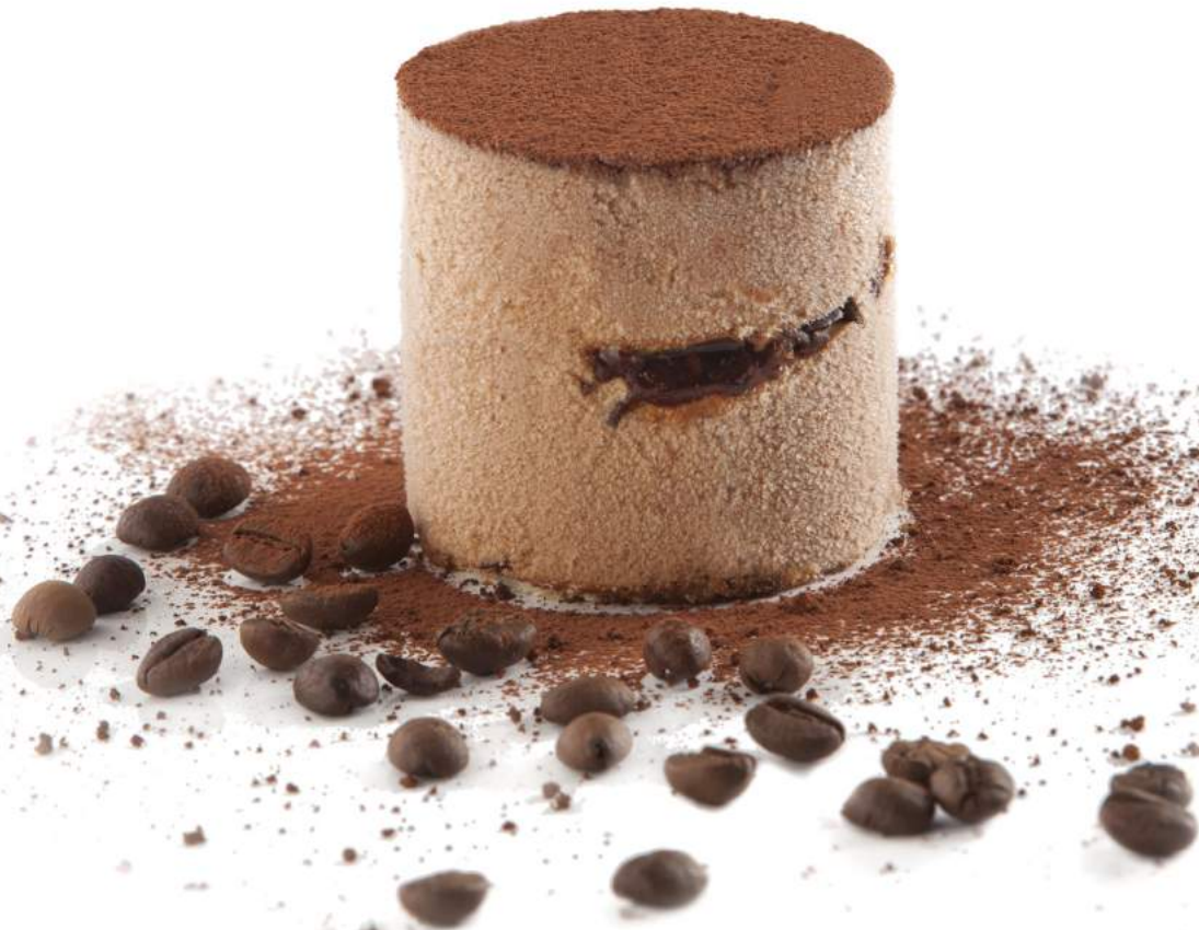
CAPRICCIO de Capuccino, Trufas y Caramelo