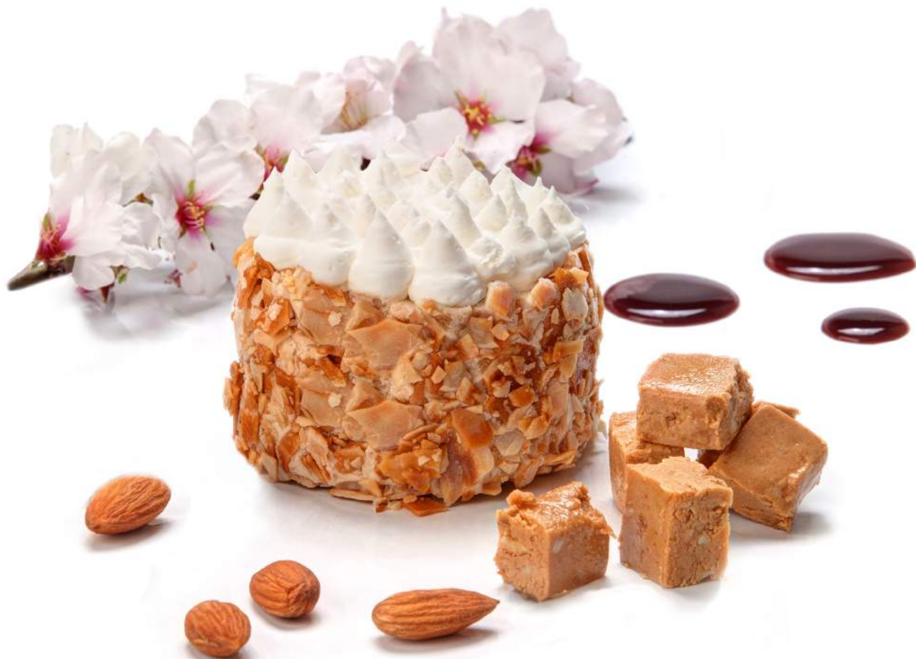
DIVO Turrón Suprema